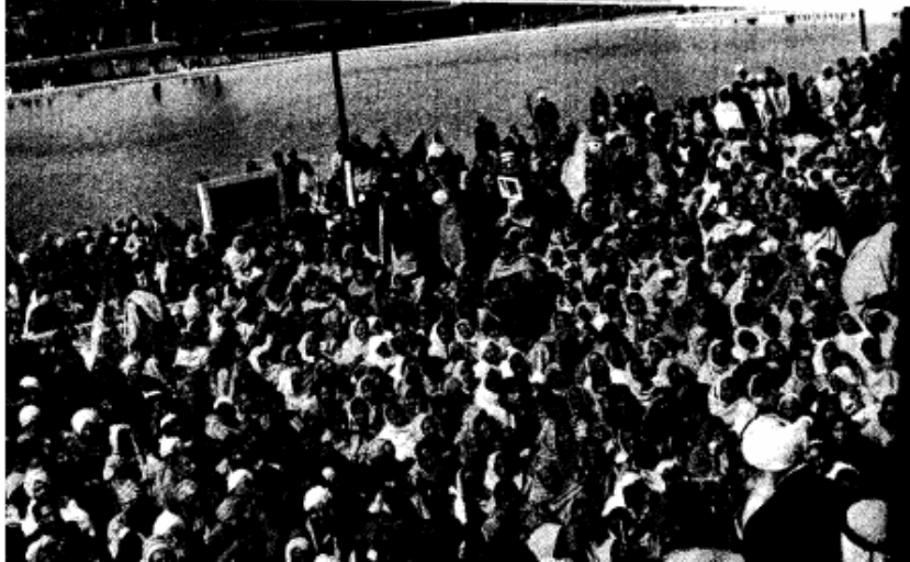
Abajo: Satsang en el Manav Kendra (Centro para el desarrollo del verdadero ser humano) en Dehradun con motivo del cumpleaños de Sant Kirpal Singh en 1972.