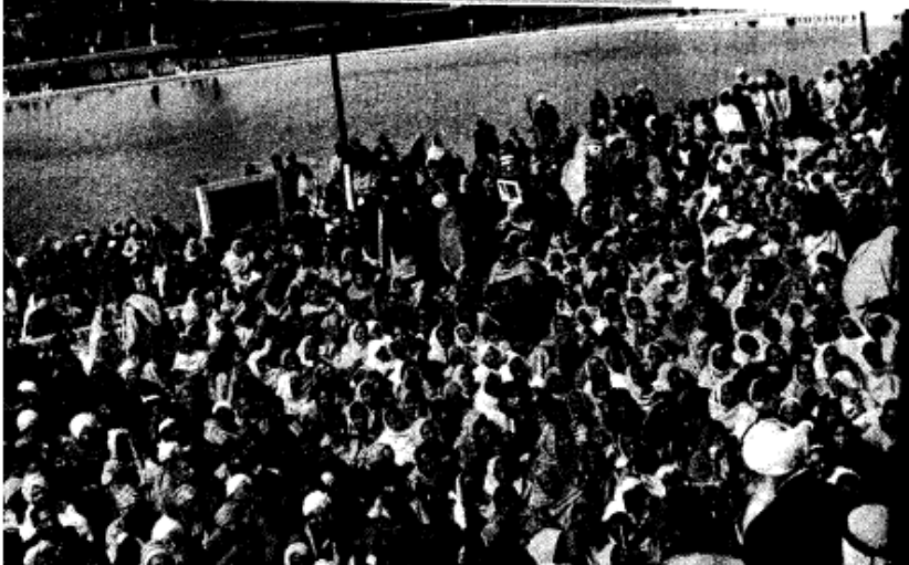
Abajo: Satsang en el Manav Kendra (Centro para el desarrollo del verdadero ser humano) en Dehradun con motivo del cumpleaños de Sant Kirpal Singh en 1972.